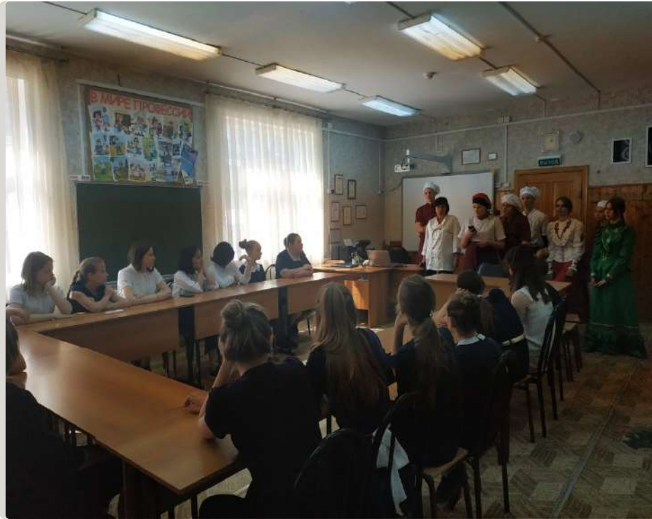
Мастер –класс КТЭК на базе МБОУ гимназии № 54

Если человек не знает, к какой пристани он держит путь, для него ни один ветер не будет попутным.